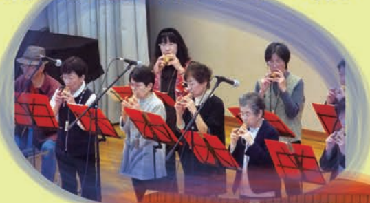
東信医療生協コカリナサークルの演奏