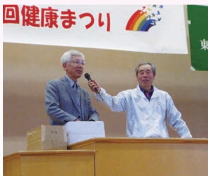
名称決定セレモニーの景品抽選

看取りの実態を述べた後、これからも往診に頑張りたいと話を締めくくりました。14人の染谷丘高校舞踊班の華麗なダンスは、アンコールの呼び声がかかる熱演で、会場では「活力をもらえる」との感想も聞かれました。信州鎌倉支部の平和を訴える群読