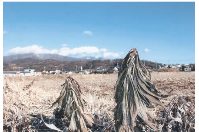
みんなの力は強いんネ

一方、医療福祉生協連の地域包括ケアは、都市部の高齢者問題だけでなく地方の課題にも対応した社会保障制度の充実をめざすものです。そして、助け合いの組織とし