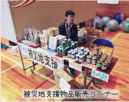
被災地支援物品販売コーナー