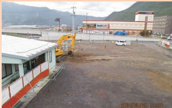
9月25日 旧駐車場が更地 になりました。