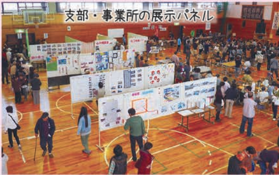
支部・事業所の展示パネル