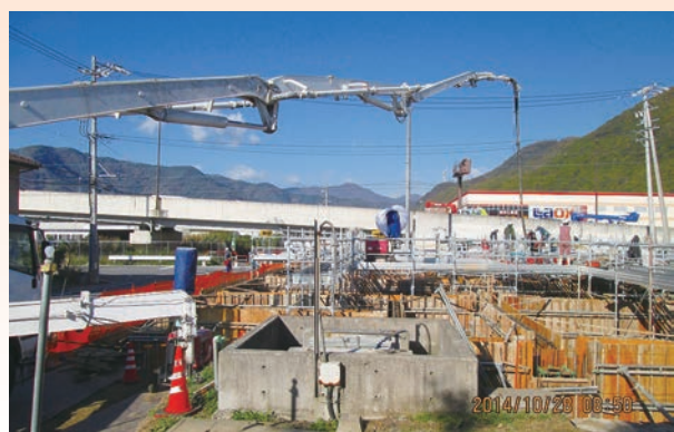
10月28日 基礎工事（生コンの注入）が始まりました。