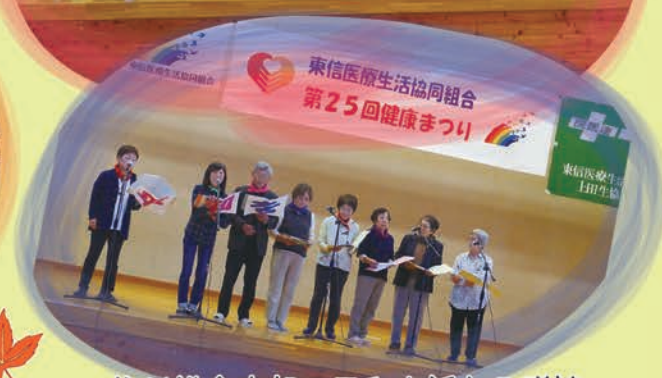
信州鎌倉支部の平和を訴える群読