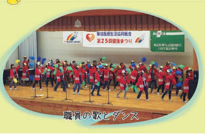
職員の歌とダンス

これらの名称に投票した71名の方の中から抽選で6名の方に賞品が贈られました。また、名称を提案した個人や事業所にも景品が贈られました。