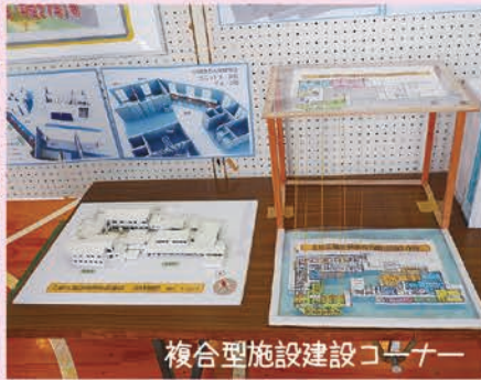
複合型施設建設コーナー