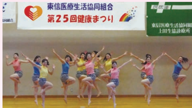
染谷丘高校舞踊班のダンス

に続き、東信医療生協コカリナサークルのコカリナ演奏に耳を傾け、健康づくり委員会の健康体操で体をほぐしました。