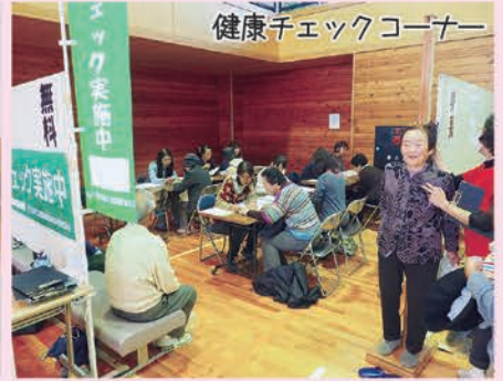
健康チェックコーナー