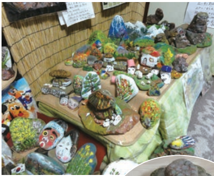
平和な山村 ▲ かめ ▶ 宮沢 由 昇 (川辺2)