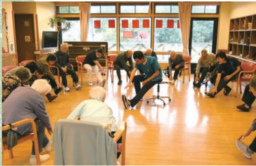
川西生協診療所デイケア

集団体操では、とくに「立ち上がり体操」に力を入れています。普段の生活の中で何気なく行っている動作ですが、足の力