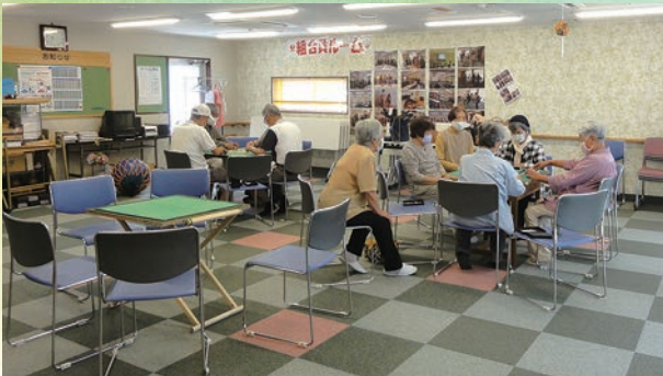
感染対策をして、活動を再開した健康マージャン